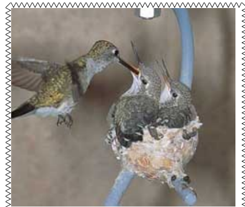
Invitación a la siguiente colibríes con un colibrí casa.