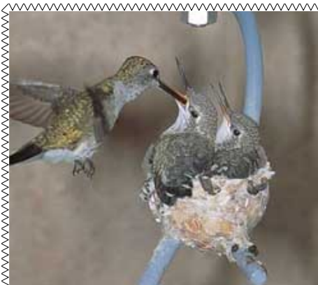
Invite hummingbirds to next with a hummingbird house.